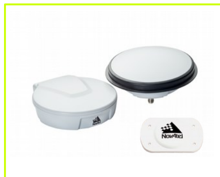
zalecane anteny precyzyjne